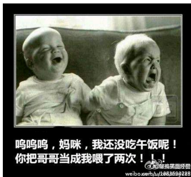
图 1.2: 图片 2