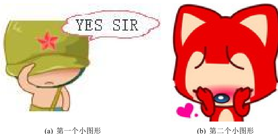
图 3.2: 包含子图形的大图形