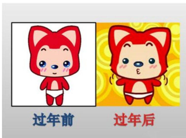
图 3.1: 搞笑图片

J2EE 技术自从被推出以来就得到了广泛认可和应用，随着多年的技术演变和发展，J2EE 技术平台已经日趋成熟，成为当今电子商务的最佳解决方案。相对于微软推出的.NET 平台，J2EE 继承了 Java 平台无关性的优点，成为金融，保险，电信等大型应用系统的首选平台方案，如图3.1所示。